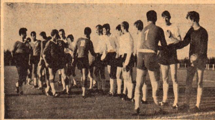
קבוצת "הפועל" קרית-אוננו, בתחילת מישחק נגד קבוצת "פיליפס" ההולנדית, שנסתיים בתוצאה 1:0 לטובת קרית-אוננו.

היום שלאחריו — יום ה' פרידה מטרדי; ושוב — מ' סיבה, הפעם מסובת-פרידה. שוב שירים, ומספר נאומים קצרים ורגשים; ראשי המש' לחת נתנו מתנות צנועות ל' שתי המשפחות שקיבלו על עצמן את הטיפול בחברי ה'