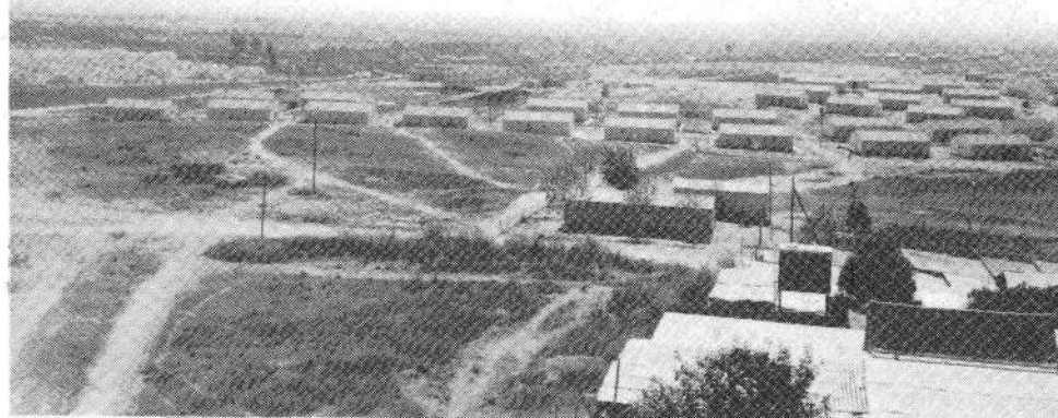
מראה כללי של הצריפים