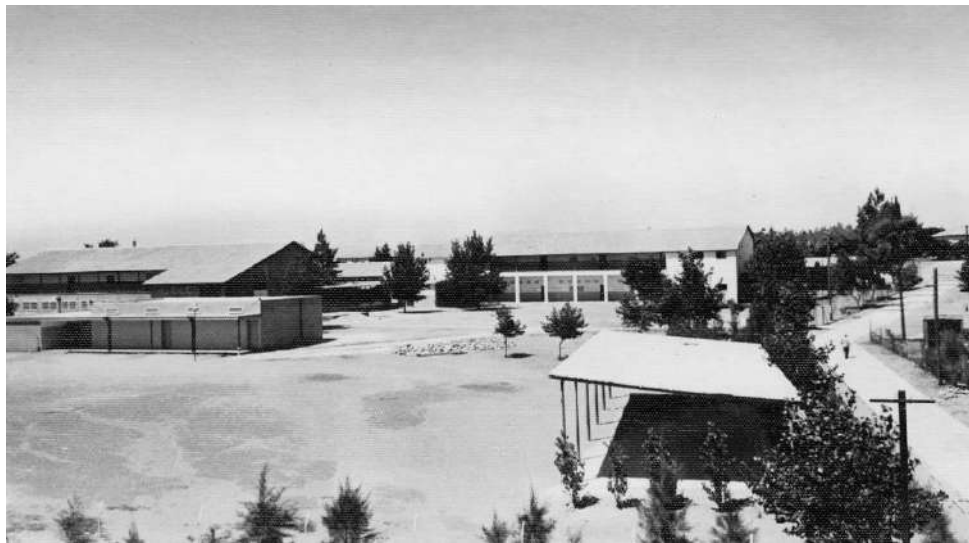
בתמונה: בית ספר "ניר" בסוף שנות השמונים

מכתב ממשדד החינוך בתחילת יולי 50 - אל כל ההנהלות, המועצות והרשויות המקומיות, מודיע כי "בימים אלו הקימונו סידור מיוחד לטיפול בילדים פרובלמטיים. המדור הזה יכלול את כל אלה, שאין להם מקום בבית הספר הרגיל: קשי חינוך, בעלי-מום וכדומה." בכפר עדיין לומדים כל הילדים יחד במסגרת הקיימת, פרט למקרים ספורים שנשלחו ללמוד מחוץ ליישוב.