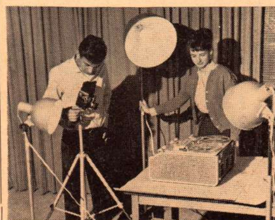
תלמידי המגמה לציילום - בפעולה. יש לציין, כי במגמה זו לומדות גם בנות, שאינן מפגרות בהשיגיהן אחרי הבנים.

עם זאת, יהול שינוי אחר בין המחזור הנוכחי לבין אלו שיבואו אחריו: בעוד שהמהדור הנוכחי מקבל 25 שעות