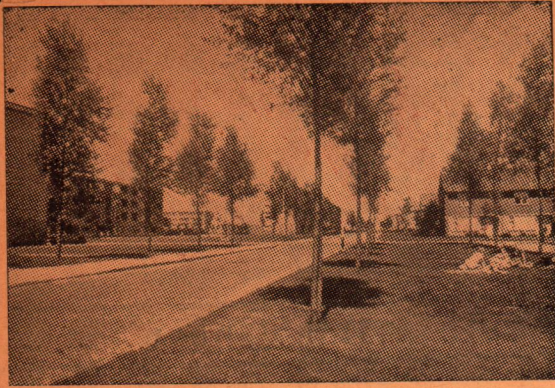
בתמונה מימין אנו רואים את ה"לאוואי", הלא הוא "בית העם" של דראכטן, בו נערכים כנסים שונים, הצגות, קונצרטים וכו'. בתמונה למעלה: כך נראה כיום רחוב מגורים טיפוסי בדראכטן, לאחר שהבתים המיושנים נהרסו ובמקומם ניבנו איזורי מגורים מודרניים.