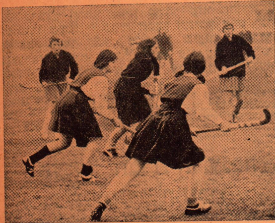
צעירי דראכטן עוסקים בסוגי ספורט רבים. בין השאר, הם תופשים את אחד המקומות הראשונים בליגת הכדורגל שלהם. בנות דראכטן, לעומת זאת, בחרו להן ספורט מקורי למדי — ההוקי — וכפי שאתם רואים בתמונה זו — הן אינן טומנות מרצן בצלחת...