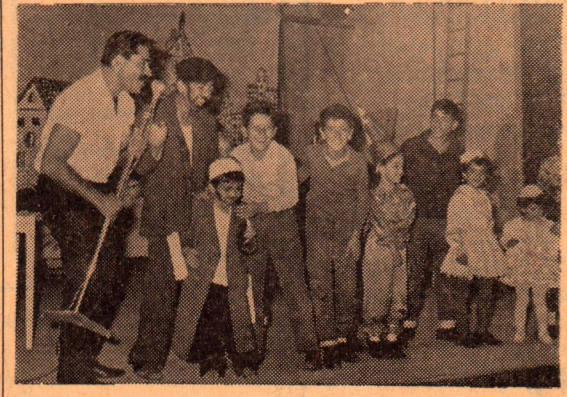
בעלי התחפושות המצטיינות בשחירת לפורים שנערכה בקריה, הועלו על הבמה וזכו בפרסים, לתשואותינו של הקהל הרב. נער שהתחפש ל"סאלח שבתי" זכה בפרס הראשון.