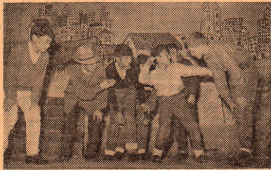
"סצירה" מתוך הצגת "הגנב" שהועלתה על ידי החוג הדרמטי בעצרת הנוער שנערכה בקריה. צעיר השחקנים בהצגה זו היה בן 9, בעוד המבוגר — בן 18.