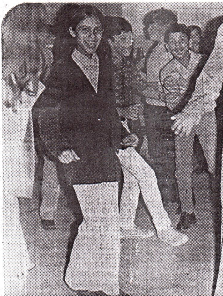
כאים למועדון בערב שבת, מפני שהאווירה מושכת, ואין מי שיגיד מה לעשות. רוצים — רוקדים, או מקשיבים למוסיקה, או נפגשים עם חברים. אבל לפעמים נמאסים גם הרוקדים הפלוניים.