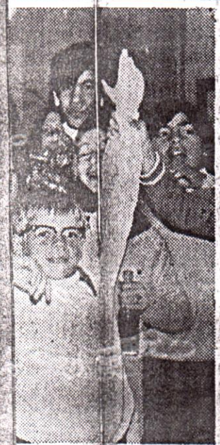
החבריה הרים פלאזא זונג... באירצון בולט חוגי החבריה עי שלנוי קרימהרה הת

הארץ עני נפגש עם חברי מועדון "צוותא" בקיראון