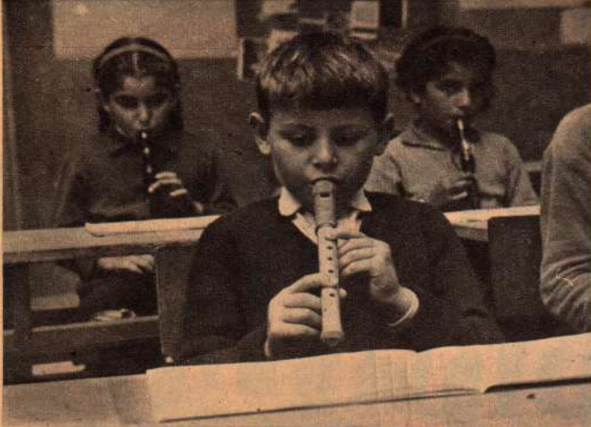
ביתת מתחילים בנגינה בחליליות בכיתת-הספר, "תלמים". בקונסרבטוריון לומדים כ-280 ילדים בני כל הגילים. השיר קורים נערכים אחרי-הצהריים.