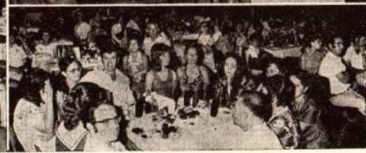
יום המורה בקריית אונו