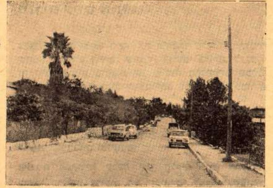
קריית-אוננו? ... עירית-אוננו? ...

קריה — על שום המקום השקט, מלוא הירק ובתים נמוכים בעלי גינות מטופחות או עיריה — אוטובוסים, עשן, רעש בתים גבוהים וכו'.