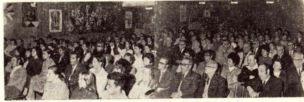
צופים — משתתפים בהרצאת שולמית אלוני ו"הערב הרוסי"