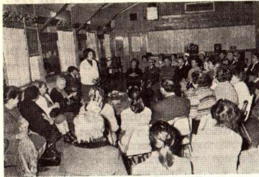
קבלת פנים בבית הנשיא לתלמידי אולפניות קרית אונו

תשומת לב התושבים מופנה שוב למועדים המדויקים בהם — ורק בהם! — יש לפנות פסולת גינה וגיוזים מחצרות הבתים (ראה מסגרת *). אנו רוצים בקריה נקיה ולא יתכן שלמחרת הפיגועי שוב יימצאו ערימות של פסולת גינה על המדרכות וליד החצרות.