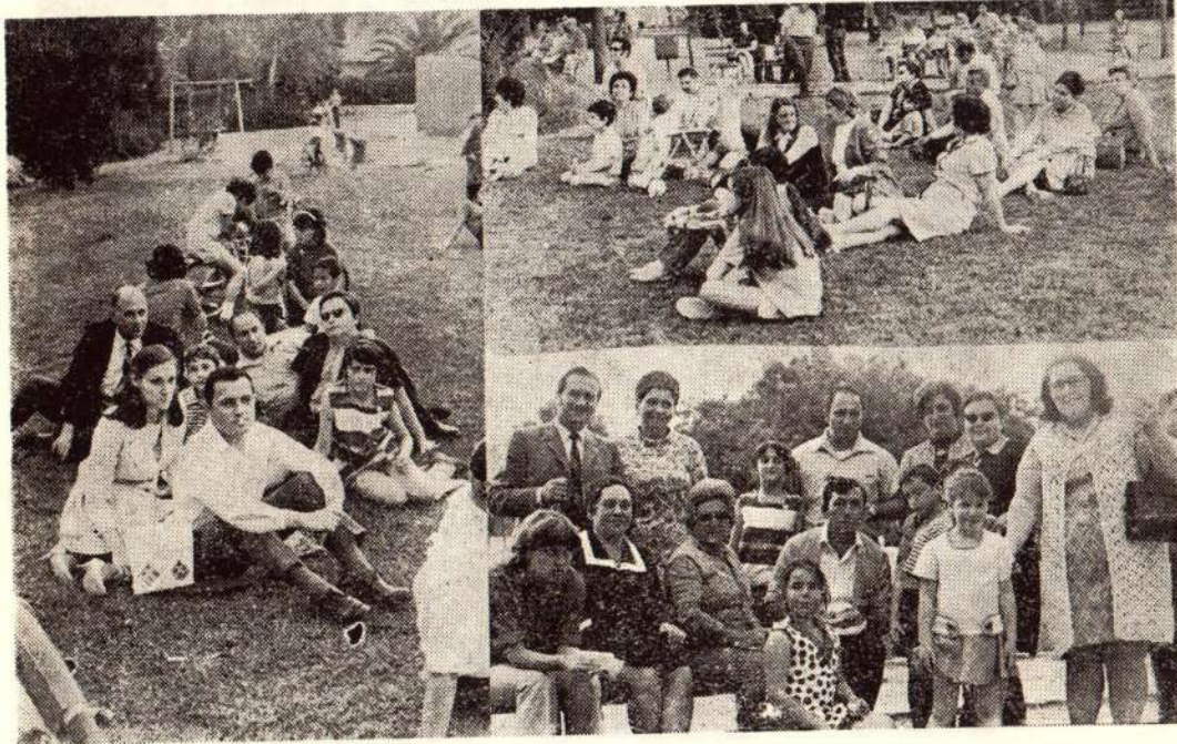
קבלת פנים ב"גן הגיבורים" במסגרת "שבוע העולה"

שבוע הפסח הוקדש בקרית אונגו לטיפוח המגע עם עולים שהגיעו לא מכבר לישראל והשתקעו בקריה. בליל הסדר ולמחרתו התארחו משפחות עולים בבתי ותיקים, ביום א' ראשון לחוהמ"פ נערכה מסיבת גן וקבלת פנים חגיגית ב"גן הגיבורים", סיורים ברחבי הקריה נערכו משך השבוע, סדר שני של פסח (אורגן ע"י מועצת הפועלים) וטיול לירושלים ומצדה היוו חלק מתכניות "השבוע" שתוצאותיו החיוביות ודאי לא יאחרו.