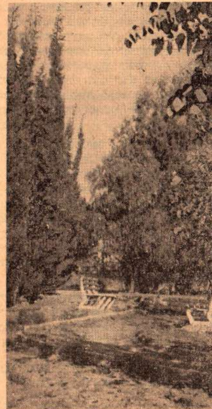
פינה בגן הגיבורים

אוננו העתיקה היתה לא רק אתר היסטורי ומרכז של חכמה, אלא גם אחת הערים הח-