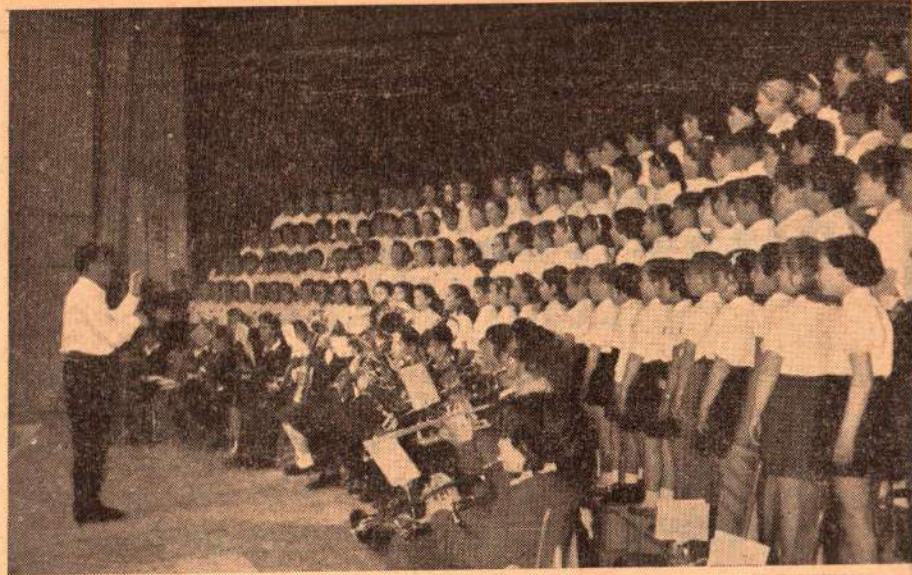
מקהלת ביה"ס „ניר“ עם חזק מהתזמורת בכנס מקהלות באפריל השנה

„... כל אותה עת ניגנה תזמורת הילדים של קרית-אונגו מנגינות-לכת ישראליות. בהגיע הצ'לן הישיש לקרבת התזמורת, נעצר כדי להאזין לנגינת הילדים הנרגשים. כך עמד כעשר דקות, כולו קשב לקלוט כל צליל מני