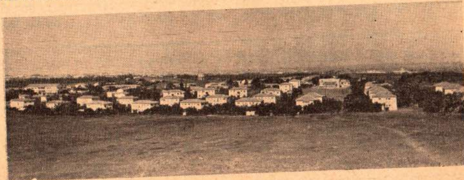
שיכון "שלטרס" בקרית-אוננו