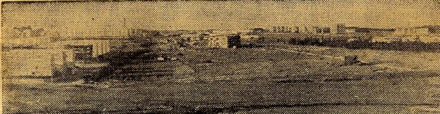
השטח הפתוח המתוכנן למזבלה, מלאכה ותעשייה. סביבו קיראון ורימון

— הרי בינתיים הוקמו וילות סביון על גבול המזבלה המתוכננת, ונבנו שיכוני קיראון ורימון. העוד צומד אתה על הקמת המזבלה? מר כהן: "ודאי שנקים זאת." לדבריו, יקוף רובע המלאכה וה' תעשייה והמזבלה כ-60 דונם נטו, וייבנה תוך שנה עד שנתיים. עוד