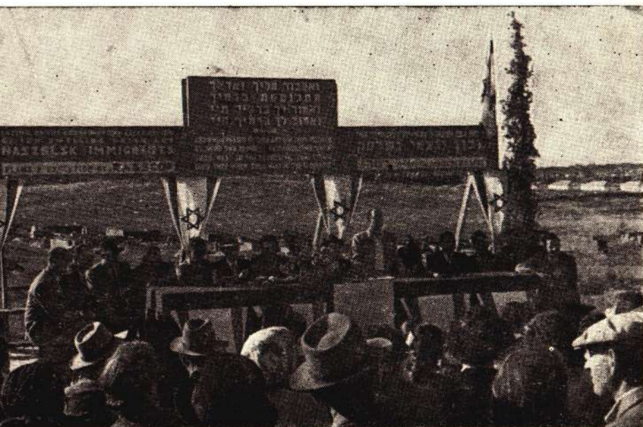
במסג הנחת אבן הפינה לשיכון יוצאי נשלסק — נחלת נשלסק.

לאחר המלחמה, עם הקמת מדינת ישר- אל, עלו ארצה שרידי השואה יוצאי נשלסק