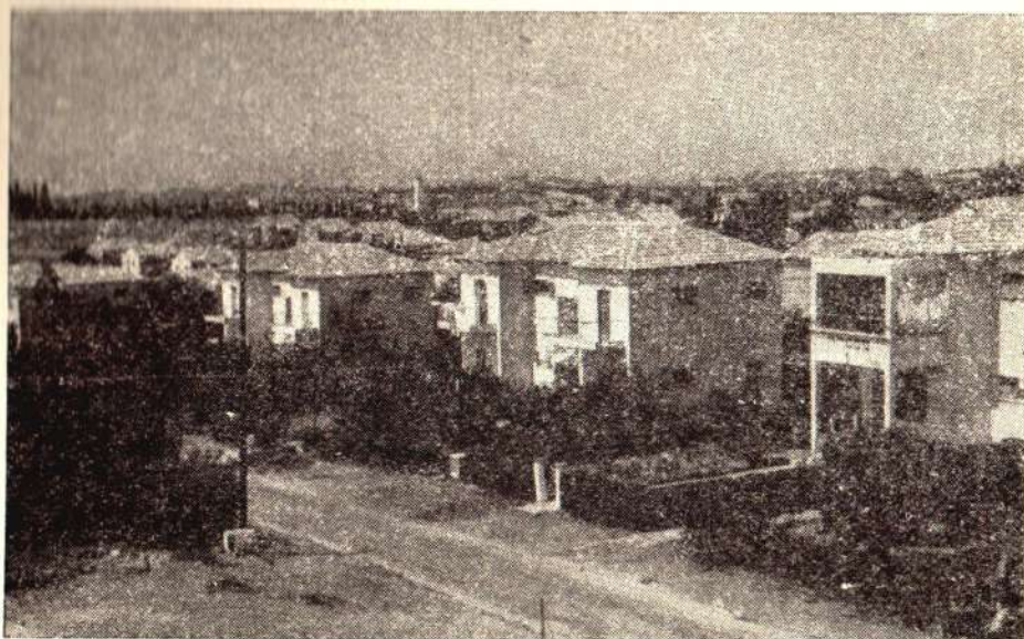
שיכון יוצאי נשלסק בקרית אונו.

הכוונים, פורצת תהומים וגבולות, מסתי- ערת וכוכשת את הנחלות וממזגת אותן בקריה אחת (ובעתיד, בעיר אחת).