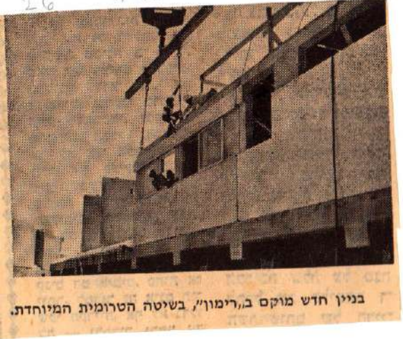
בניין חדש מוקם ב"רימון", בשיטה הטרומוית המיוחדת.