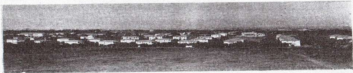
שיכון "שלטרס" בקרית-אוננו